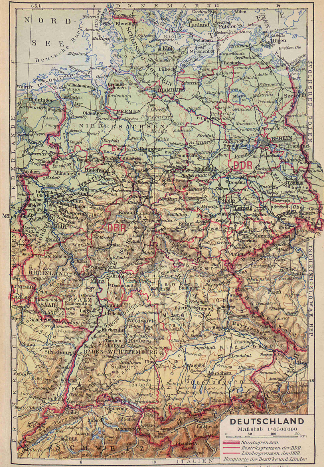
Ausschnitt entnommen aus dem Weltatlas des VEB Bibliographisches Institut Leipzig