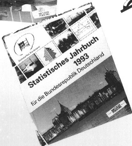
Statistisches Jahrbuch 1993 für die Bundesrepublik Deutschland