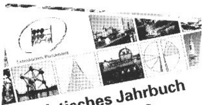
Statistisches Jahrbuch 1993 für das Ausland

Die Volkswirtschaftlichen Gesamtrechnungen haben die Aufgabe, ein möglichst umfassendes, übersichtlich gegliedertes, quantitatives Gesamtbild des wirtschaftlichen Geschehens zu geben, in das alle Wirtschaftlichen Größen, Institutionen mit ihren wirtschaftlichen Beziehungen des Wirtschaftsablaufs einbezogen sind. Um das Bild übersichtlich darzustellen und damit die Vergleichbarkeit der Daten zu gewährleisten, wird die Vielzahl der Wirtschaftseinheiten in Gruppen zusammengefasst und statistisch zu gestalten zu großen Gruppen zusammengefasst. Die Ergebnisse der amtlichen Volkswirtschaftlichen Gesamtrechnungen werden in Form eines geschlossenen Kontensystems mit doppelter Verbuchung dargestellt, wobei die Kontenpositionen, die das Kontensystem bilden, in einer Reihe von Tabellen nach Sachgruppen, Wirtschaftszweigen, Wirtschaftssektoren, Wirtschaftsklassen, Wirtschaftskontingen und in einer Reihe von Tabellen dargestellt sind. In den Tabellen werden die Kontenpositionen, die das Kontensystem bilden, in einer Reihe von Tabellen dargestellt sind. In den Tabellen werden die Kontenpositionen, die das Kontensystem bilden, in einer Reihe von Tabellen dargestellt sind.