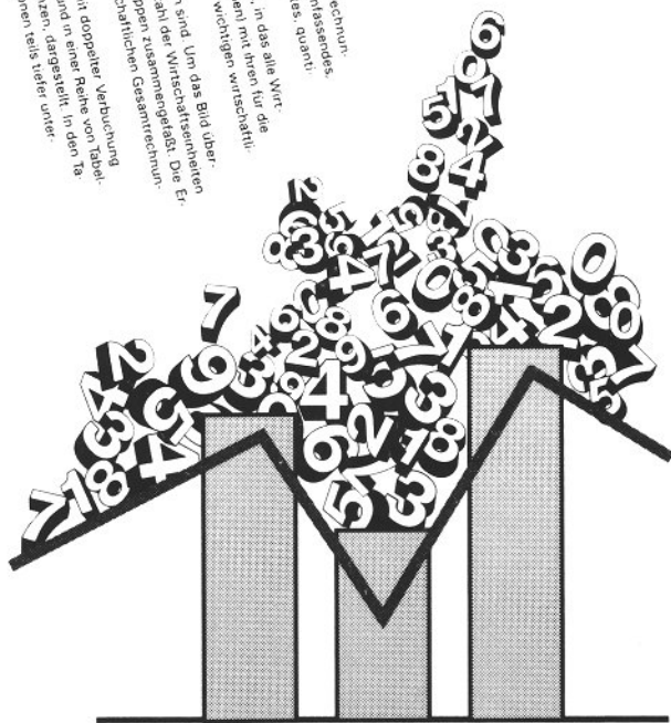
Statistisches Jahrbuch 1993 für die Bundesrepublik Deutschland