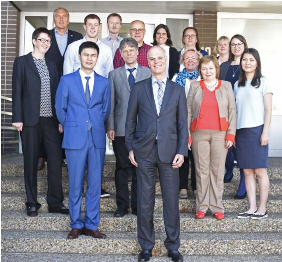
Die Delegation aus Kasachstan mit Vertretern der deutschen Außenhandelsstatistik.

Der Fachaustausch vom 18. bis 22. Juli war die letzte Maßnahme im Bereich der Außenhandelsstatistik im Rahmen des KAZSTAT-Projektes. Vorausgegangen waren erste Beratungen durch Fachleute der Außenhandelsstatistik des Statistischen Bundesamtes in Kasachstan und ein Studienbesuch kasachischer Fachleute in Wiesbaden im Jahr 2015.