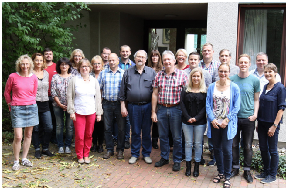
Teilnehmerinnen und Teilnehmer des Workshops zur Agrarstrukturerhebung in der Zweigstelle Bonn des Statistischen Bundesamtes.

Die Feldphase der Agrarstrukturerhebung (ASE) 2016 läuft seit etwa einem halben Jahr und dauert noch bis Februar 2017. Um während der Feldphase Erfahrungen und Tipps für die Erhebungsdurchführung austauschen zu können, trafen sich am 27. und 28. September Vertreterinnen und Vertreter der Statistischen Ämter des Bundes und der Länder auf Einladung des Bereichs „Agrarstrukturen, Integration neuer Themen, Georeferenzierung“ zu einem Workshop in der Zweigstelle Bonn des Statistischen Bundesamtes.