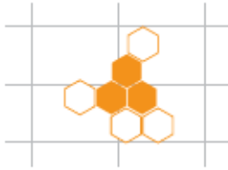
Schaubild des Monats