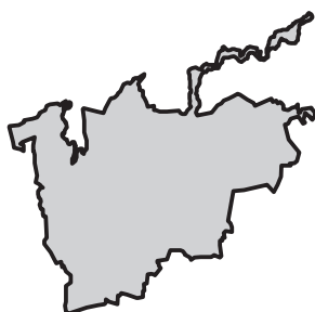
Brandenburg an der Havel

Historisches Gemeindeverzeichnis des Landes Brandenburg 1875 bis 2005