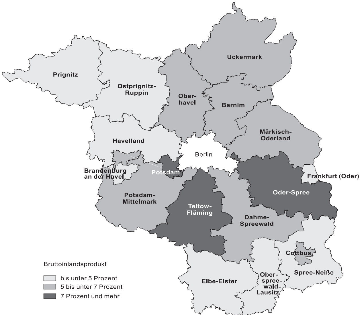
Grafik 1: Anteil des Bruttoinlandsprodukts in jeweiligen Preisen 2005 der Verwaltungsbezirke am Land Brandenburg insgesamt